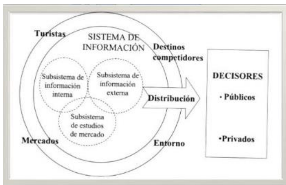
Figura 2. Estructura de (SIT).

Para la estructuración del sistema de información turística como mejoramiento de la oferta en las playas rurales de Manta se utilizó la observación directa como técnica.