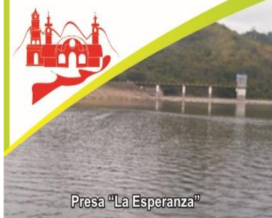
Presa "La Esperanza"