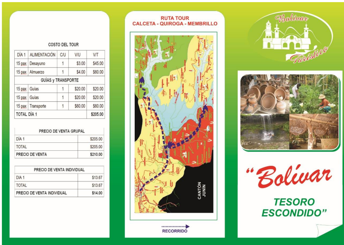
Figura No. 2: Tríptico de la segunda ruta del Producto Turístico “Bolívar Tesoro Escondido”