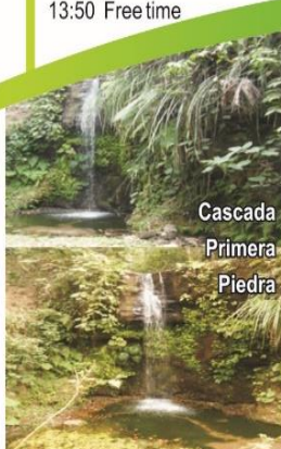
Cascada Primera Piedra